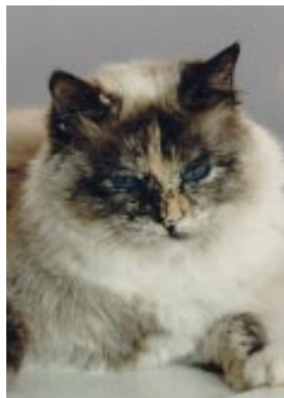
Hilken Red Progress. Mor till ... Hilken Red Flame & Cream Debutante - de första importerna i den röda färgen.

Den första chokladmaskade birma som tog titel i Sverige var engelska importen Mandessa Hester. Hon tog sin championtitel 1987. Året efter, 1988 fick vi landets första lilamaskade champion - en svenskuppfödd hona vid namn Eldholmens Cilia - dotter till Hester. >