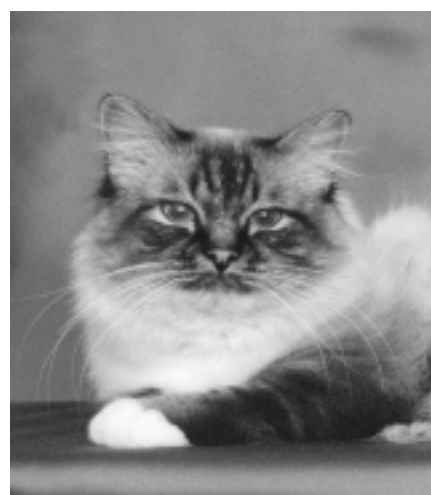
EC Skogshöjdens Outsider. Den första tabbybirma som blev Årets Katt (1998)