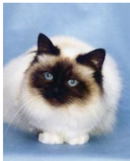
EC S*Grazette's Koh-I-Noor. Årets Katt i SVERAK 1993. Hade både svensk och engelsk kontrollavel nära.

Birmarasen växte, och nästa "milstolpe" kom kanske 1979 under Stockholms Kattklubbs stora utställning på Älvsjö Mässan. Trettio birmor - bruna och blå - fanns utställda. När utställningen stängde kunde man konstatera att en birma för första gången tagit hem titeln Best-in-Show. Hennes namn var Krusestorps Cerina. På den tiden tävlade birmorna som långhår - tillsammans med perser. Perserkatterna var då den absolut mest representerade rasen på våra utställningar.