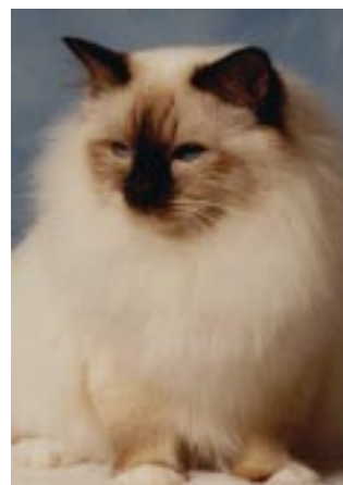
Tidig svenskfödd choklad, EC S*Grazette's Image Maker. Född 1990. Far till två Årets Katt.