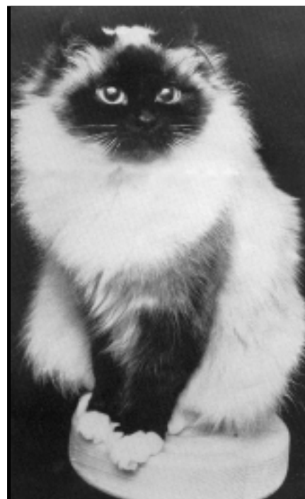
IC Krusestorps Cerina Första birman som blev Best-In-Show