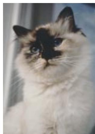
CH Backkaras Pemba. Den första av de röda varianterna som tog champion-titel.