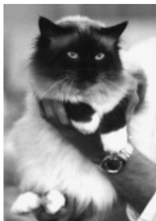
IC Hassellidens Thai. Den första birma som blev Årets Katt i Birmasällskapet.