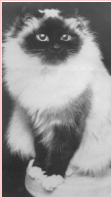
IC Krusestorps Cerina